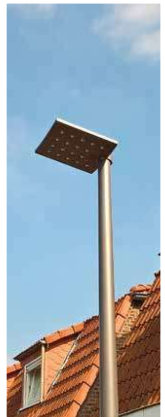
IN OVERDINKEL (GEMEENTE LOSSER) IS EEN HOEKIG LED-ARMATUUR TOEGEPAST, DAT HET CONTRAST ZOEKT MET DE HONDERD JAAR OUDE, TUINDORP-ACHTIGE ARCHITECTUUR VAN DE WONINGEN.

Wij zullen onderzoek op dit gebied op gang brengen bij de opleidingen stedenbouwkundig ontwerpen van verschillende hogescholen. Wilt u ons hierbij helpen, en ziet u aanknopingspunten? Laat het ons alstublieft weten.